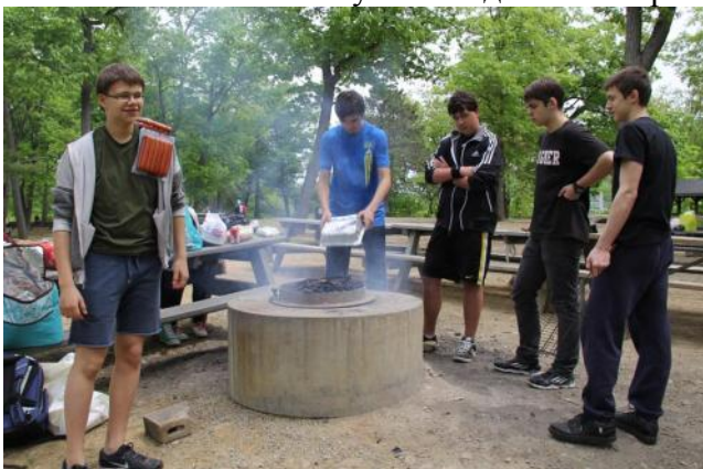
Надо приготовить обед – это привилегия настоящих мужчин