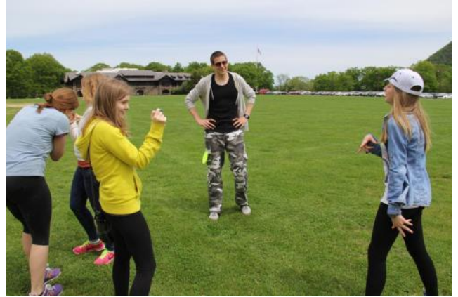
А у нас последний день здоровья в школе...