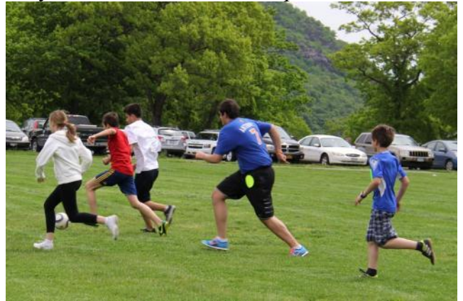
Футбол - это замечательно!