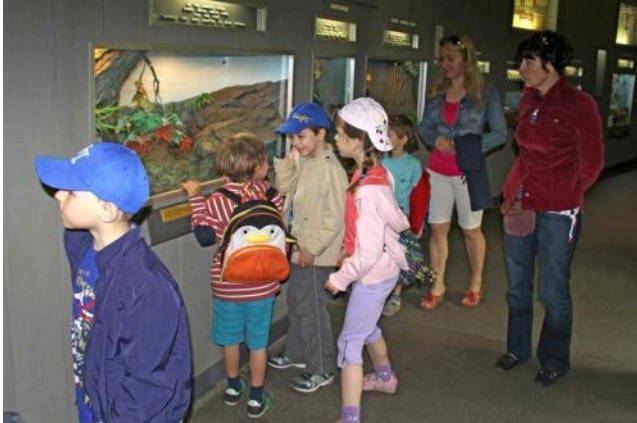
Первоклассники в зоопарке