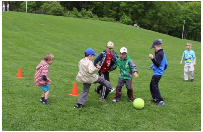
Какой чудесный день!