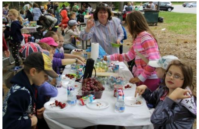
Как всё вкусно на природе...