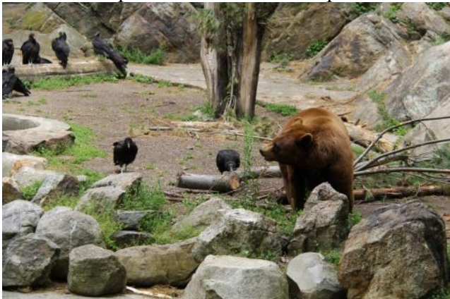
Вот такие мишки живут на Медвежьей горе