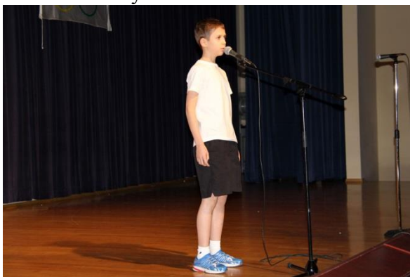
Стихи об олимпийском огне: «Он всегда бывает разным, удивительный огонь...»