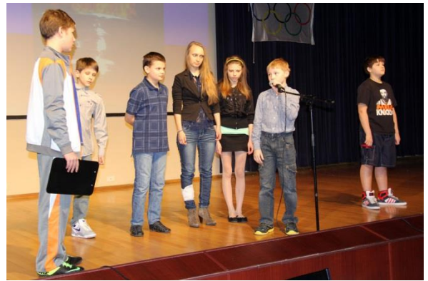
На сцене – урок физкультуры.