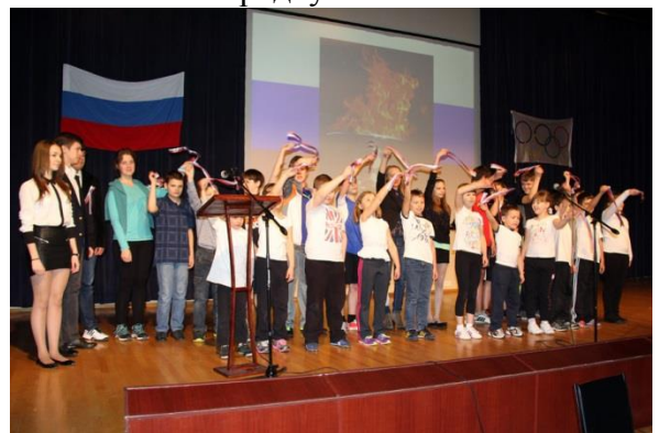
И пусть у всех нас будет отличное настроение и крепкое здоровье. До встречи на спортивных площадках!