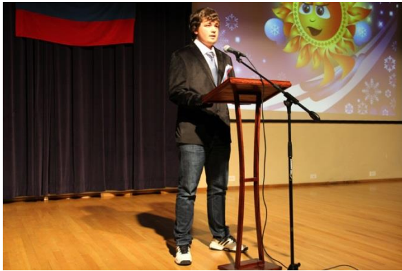
Президент малой олимпиады торжественно объявляет её открытие.