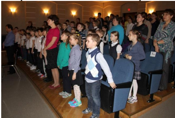
Звучит гимн России.