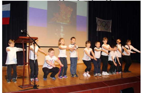
Второй класс! Просыпайся, не ленись, на зарядку становись!