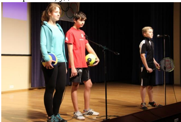
«О спорт! Ты воспитатель поколений. Большого друга верная рука»