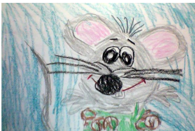
«Села мышка в уголок, съела бублика кусок» (Чистякова Настя)