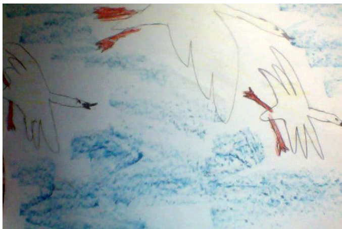
«Летели лебеди с лебедятами» (Тлеккабыл Ясмин)