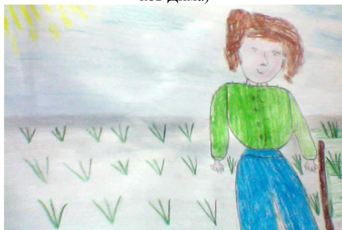
«Пошла Поля полоть петрушку в поле» (Агарёв Алексей)