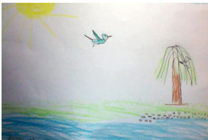
«На иве галка, на берегу галка» (Королёва Василиса)