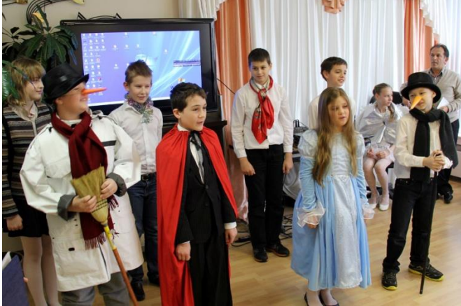
Вот такой предстала перед зрителями команда 5 класса.