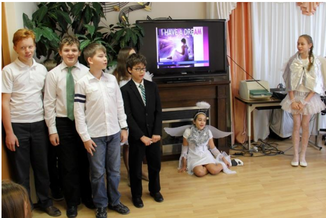
6 класс исполнил рождественскую песню.