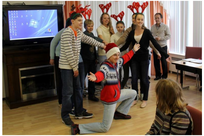
А это команда северных оленей – 7 класс.