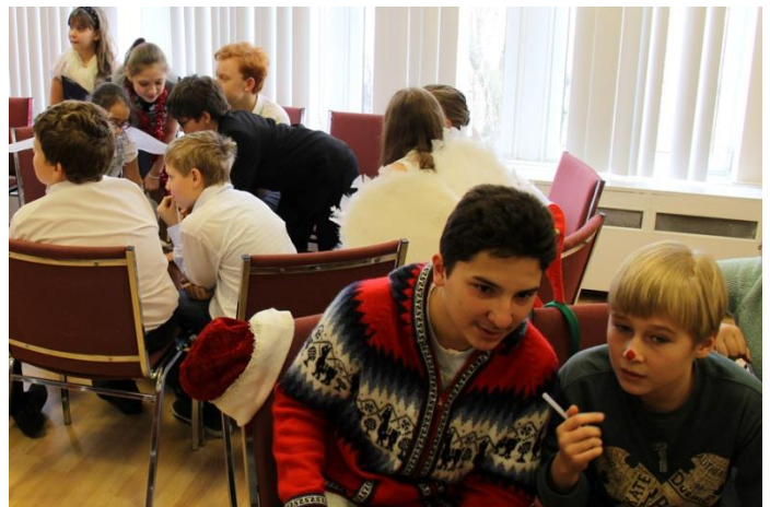
Команды думают, жюри подсчитывает баллы.