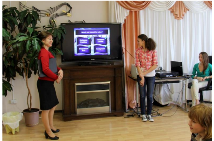
Попробуй ответить на сложный вопрос, да ещё на английском языке!