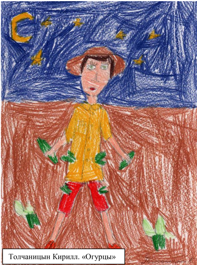
Толчаницын Кирилл. «Огурцы»

На уроках рисования и занятиях кружка изобразительного искусства наши ребята создают почти шедевры. Нам кажется, этим ученикам нужно продолжить занятия творчеством и в дальнейшем. Мы уже печатали «осенний букет» из рисунков наших школьных художников. Представляем сегодня вашему вниманию очень хорошие, на наш взгляд, рисунки.