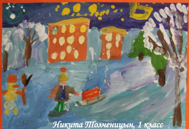
Никута Похменцын, 1 класс