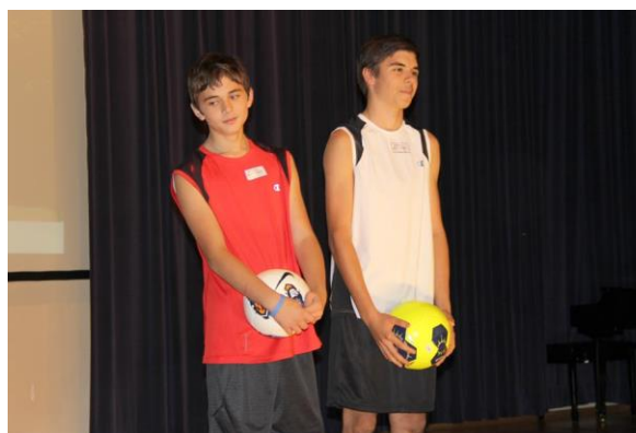
А «топ-модели» нашей школы продемонстрировали новую спортивную форму.