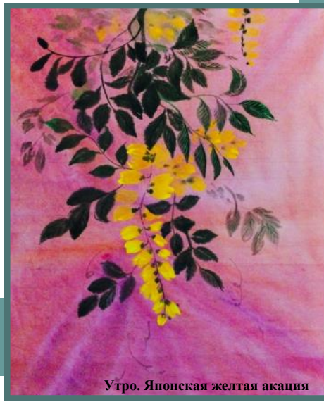
Утро. Японская желтая акация