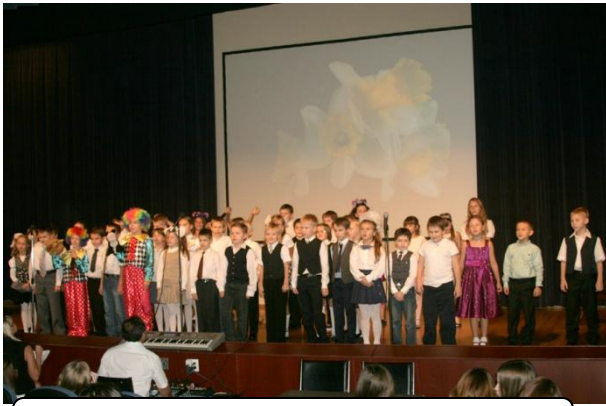
Сводный хор поёт песню «Новый день»