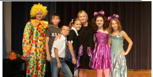
Вот на такой оптимистической ноте и закончился концерт. А это фото на память с любимым наставником.