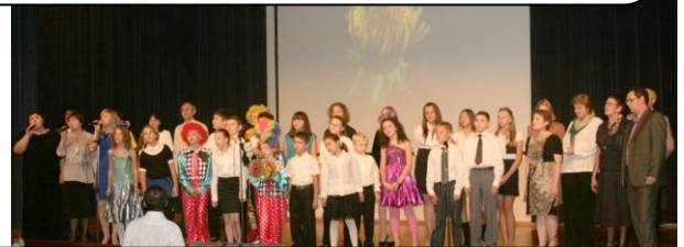
Грусть как рукой снимает, когда на сцену выходит почти весь коллектив! Дирижёр – на месте. И... «Пускай капризен успех, он выбирает лишь тех, кто может первым посмеяться над собой. Пой. засыпая. пой во сне. проснись и пой!»