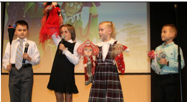
А это артисты кукольного театра. Они рассказали нам о том, что без кукол жизнь скучна...