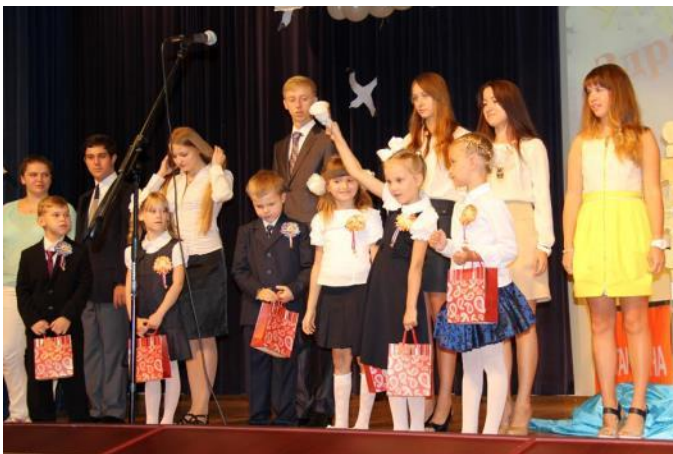
Дан старт новому учебному году! В добрый путь, школьный корабль!