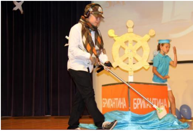
Великий сыщик Агасандян Артём